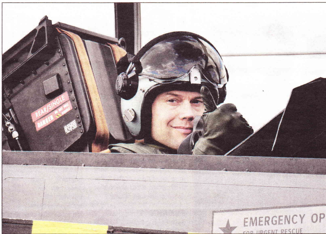
PILOTPROJEKT. Prins Daniel fick testflyga en JAS 39 på F21 i Luleå.