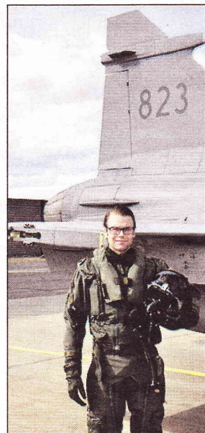
Prinsen flög i 1 200 km/h